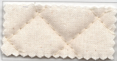
No.1 生成 (綿カス付)